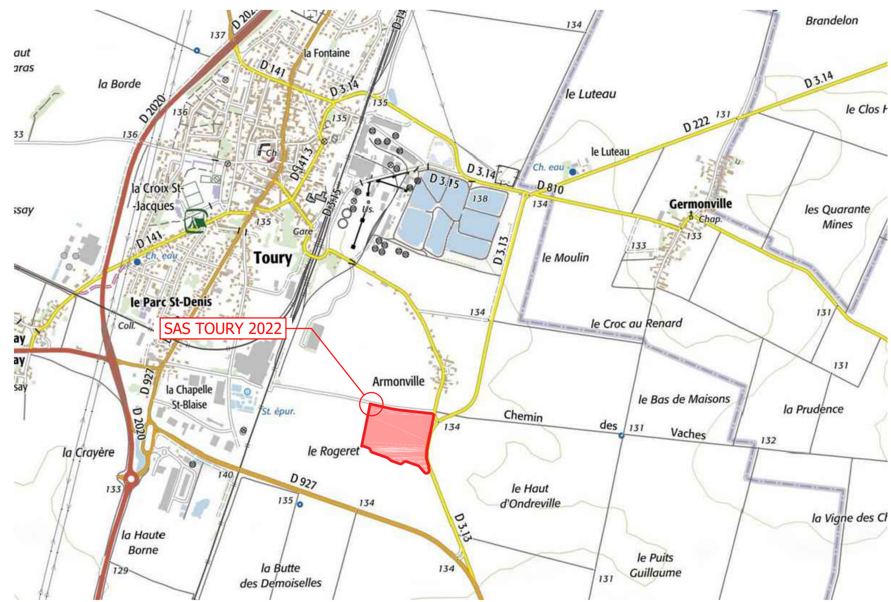
SITUATION - 1/10000e