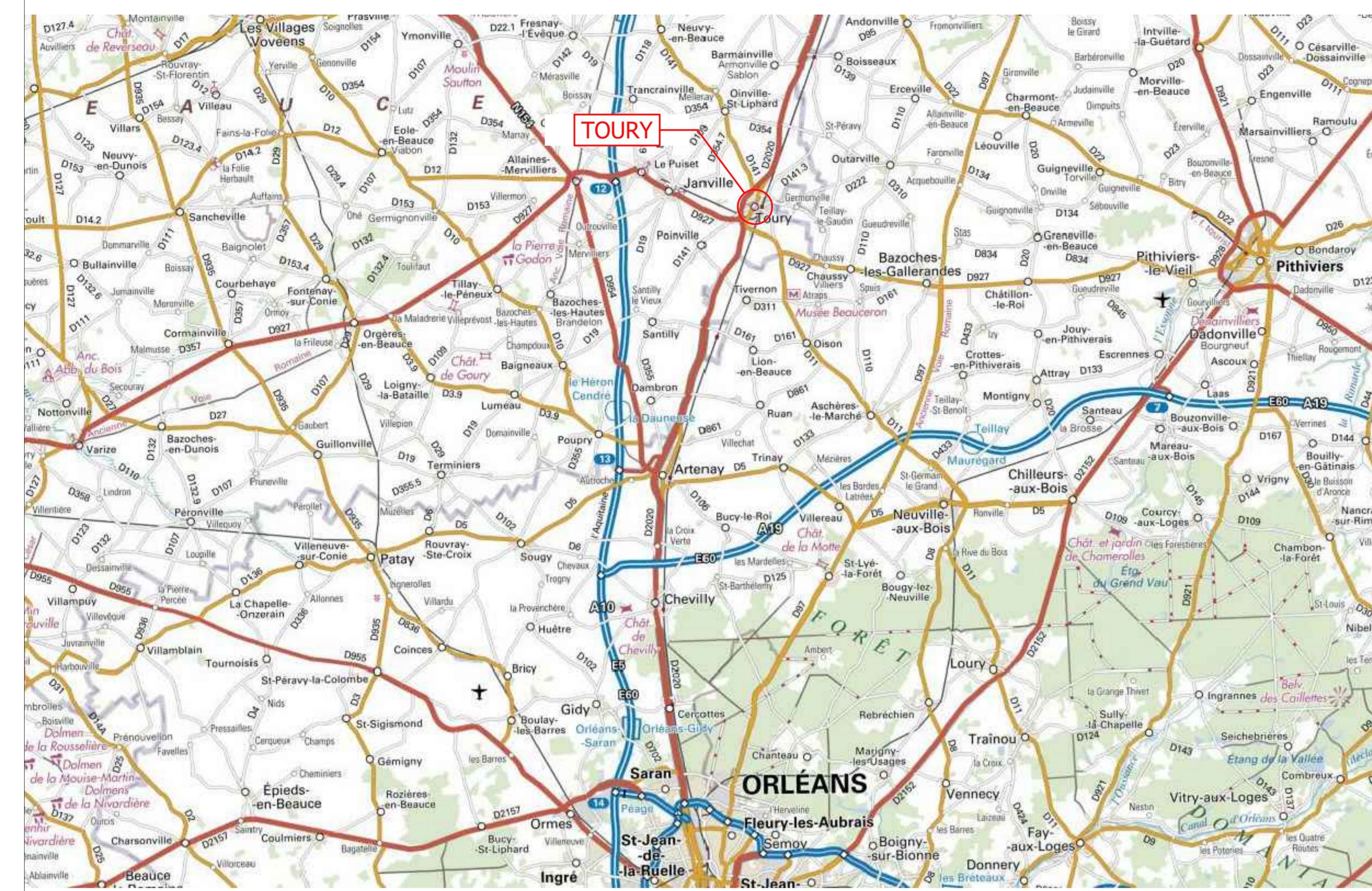
SITUATION - ECHELLE GRAPHIQUE